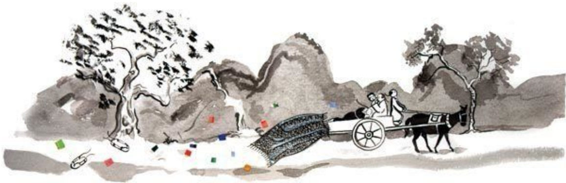
Ilustração: Cris Burger