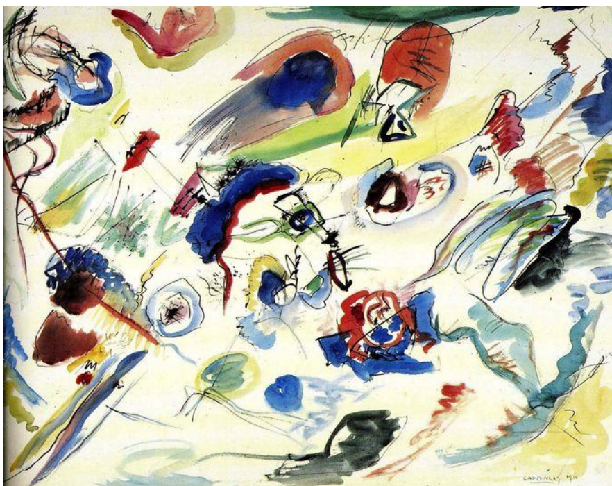
Primeira Aquarela Abstrata (1910), do russo Wassily Kandinsky.

O abstracionismo provocou muita indignação entre os apreciadores de arte mais tradicionais. A Arte Abstrata era considerada de extremo mau gosto pela elite que ainda preferia ver nas pinturas e nas esculturas algo que representasse a realidade, e de preferência que promovessem ideais clássicos e perfeição artística.