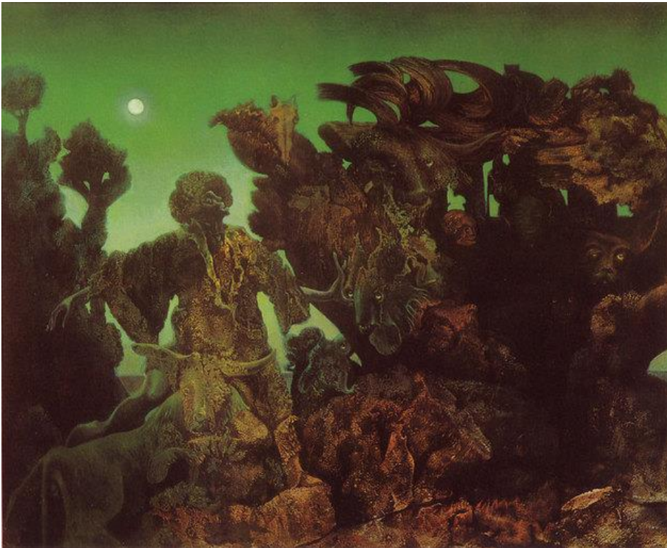
Epifania (1940), de Max

Em 1925, o pintor alemão Max Ernst (1891-1976) - antes dadaísta - inventou a técnica frottage , palavra que em francês significa "friccionar". Nesse método, o artista fricciona o lápis (ou outro material) em um papel sobre uma superfície texturizada. Assim, imagens surgiam e eram usadas como apareciam, ou serviam como base para um novo desenho.