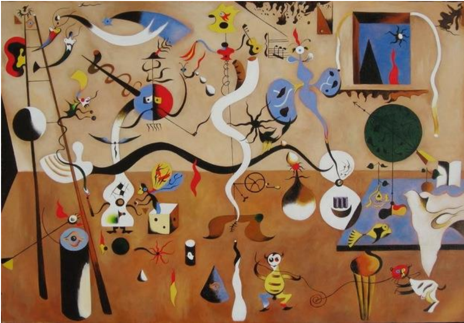
Carnaval de Arlequim (1924-