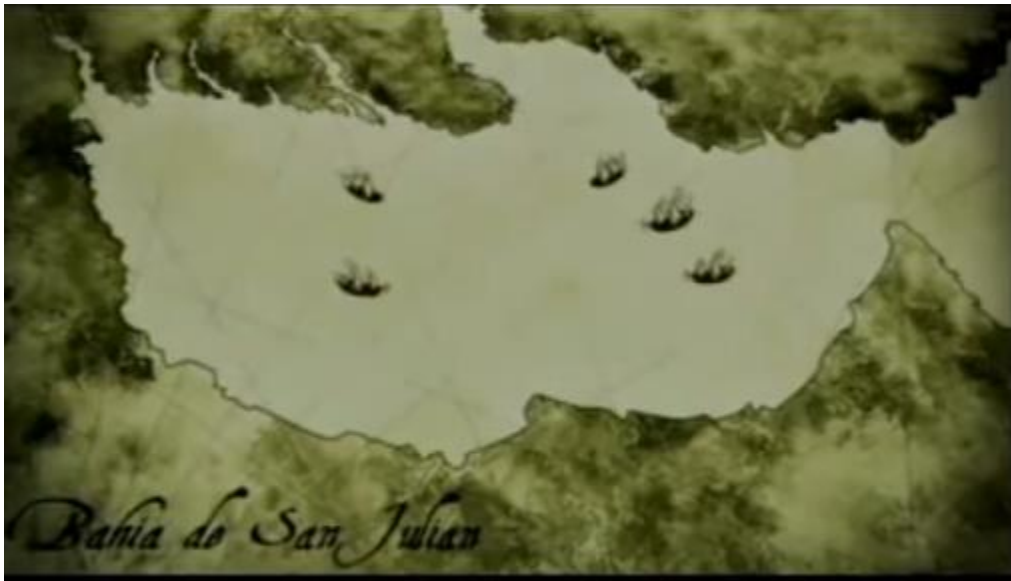
Fernão de Magalhães Grandes Navegadores

https://www.youtube.com/watch?v=UWVfclIROcM&t=5s