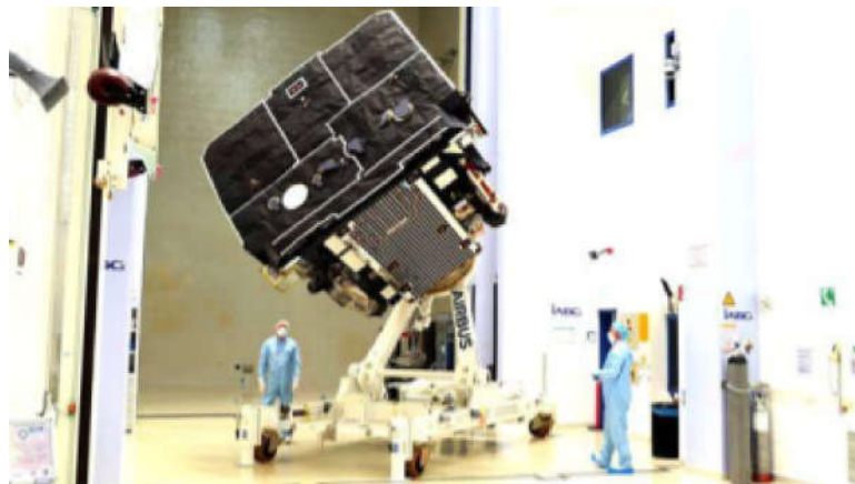
Imagem 2: A Soho levou oito anos para ser construída e testada