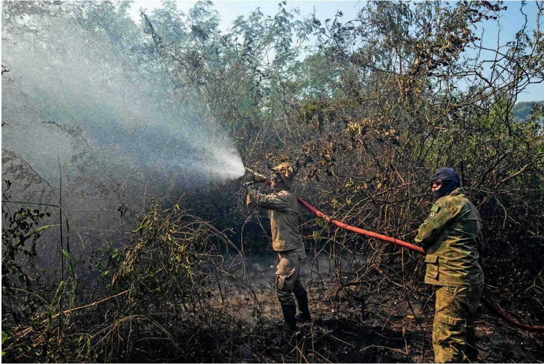
COMBATE - Em campo: brigadistas tentam conter o avanço do fogo