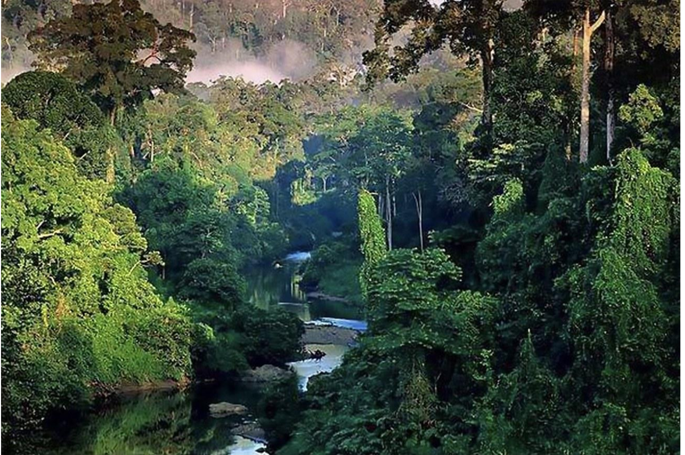
A densa floresta.

A maior floresta úmida do planeta é também a número um em diversidade de plantas, peixes de água doce e mamíferos. É a segunda em anfíbios, e a terceira em diversidade de répteis. Só em espécies vegetais são 55 mil, 22% de todas conhecidas no mundo. Mas tem mais: 524 espécies de mamíferos, 517 de anfíbios, 1.622 de pássaros, 486 de répteis. 3.000 espécies de peixes, e entre 10, a 15 milhões de insetos!