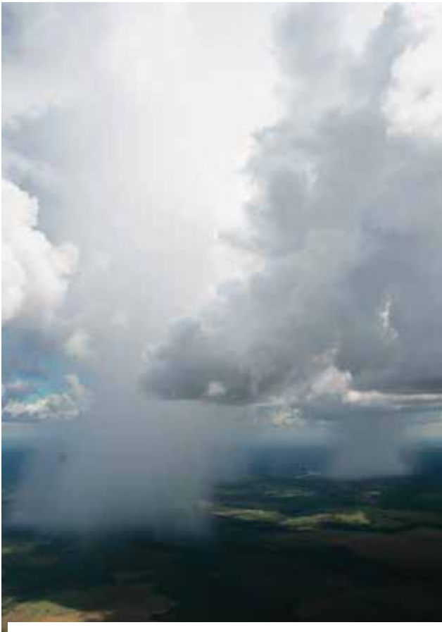
Os rios voadores carregam tanta água quanto os rios terrestres

b) os recursos hídricos são abundantes e os regimes fluviais não serão alterados, apesar das mudanças climáticas que ameaçam modificar o regime de chuvas na América do Sul.