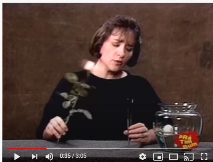
Rá-Tim-Bum: A princesa e o Sapo - Contadores de Histórias