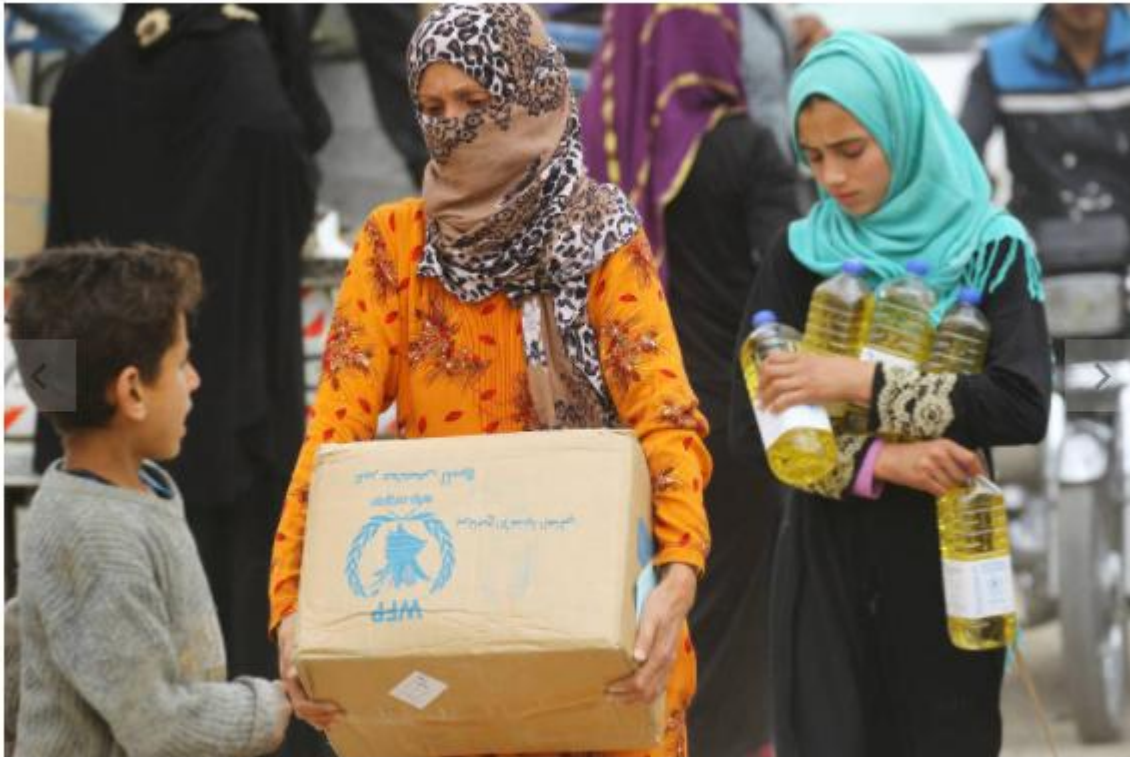
Mulheres carregam caixas de comida distribuída pela ONU em Raqqa, na Síria Aboud Hamam - 26.abr.2018/Reuters