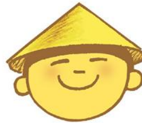
O Menino da Terra